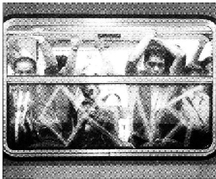
Para afrontar la crisis económica se debe considerar la reducción del boleto del Metro.