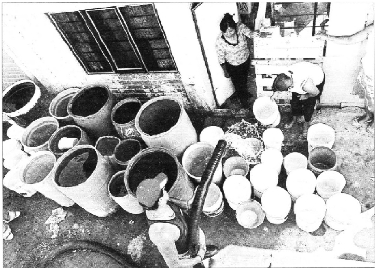
En la delegación Ixtapalapa, en lugares como el campamento Desollado, el abasto de agua se hace mediante pipas y se acarrea en cubetas por la falta de una red de distribución