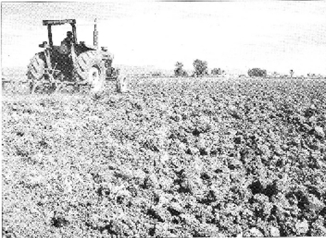
DANOS. En los últimos 58 años, es la mayor pérdida de cultivos que se ha registrado en México cuando se comparan los datos de 1957 y 1983

con la Sagarpa, es la entidad porcentualmente más afectada, pues de las cien mil hectáreas a sembrar en el ciclo primavera-verano, se sembraron 70 mil, de las cuales casi la mitad ya se echó a perder.