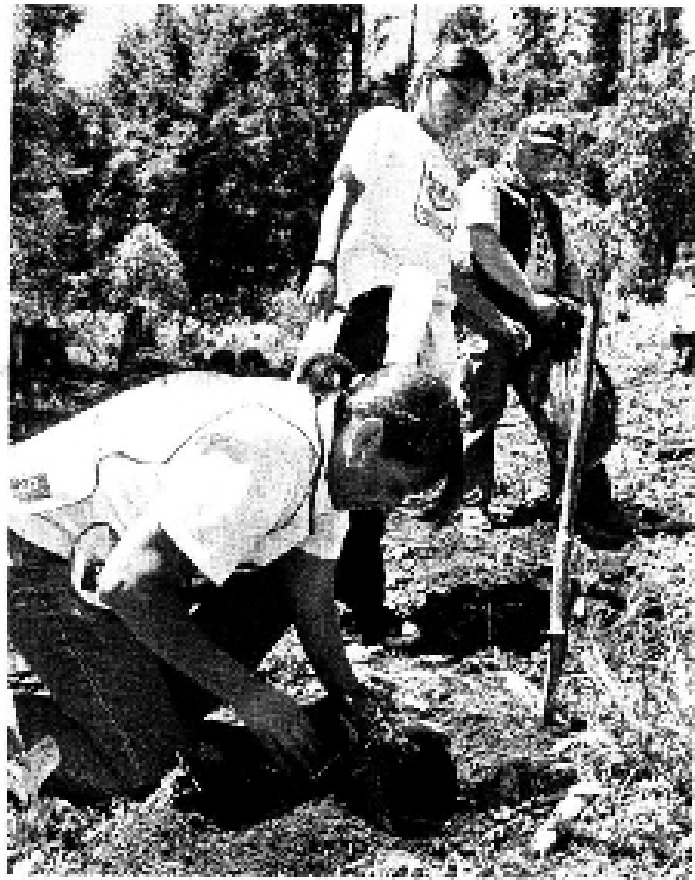
> El pasado domingo, unos 8 mil 500 árboles fueron plantados en el paraje La Cachucha, en el Municipio de Ocuilan, Estado de México.