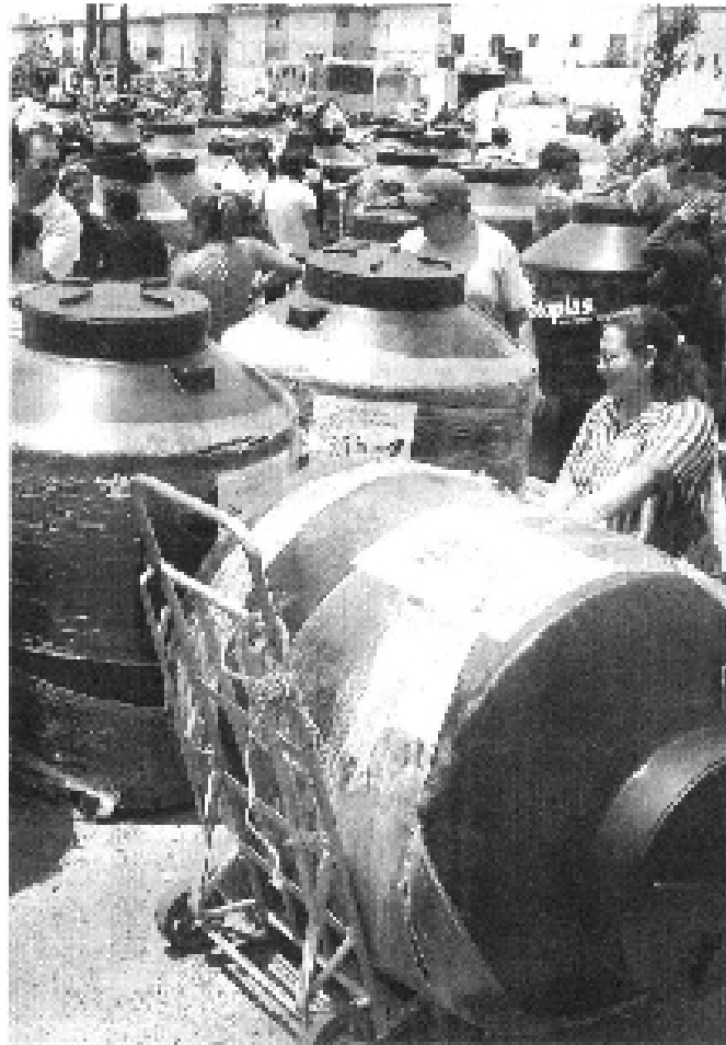
DISTRIBUCIÓN. El reparto se realizó en Cabeza de Juárez

—¿Y cómo va a llenar su nuevo tinaco si no hay agua ?—, se le preguntó.