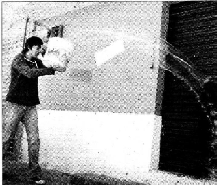
CASTIGO. La administración local cazará a quienes desperdicien el líquido.