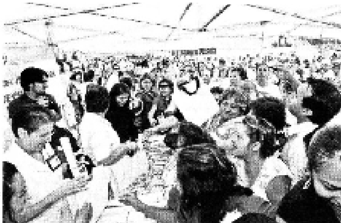
Durante el evento se explicó el funcionamiento de los equipos ahorradores de agua, como regaderas y 'sapitos', que serán entregados a partir de hoy.