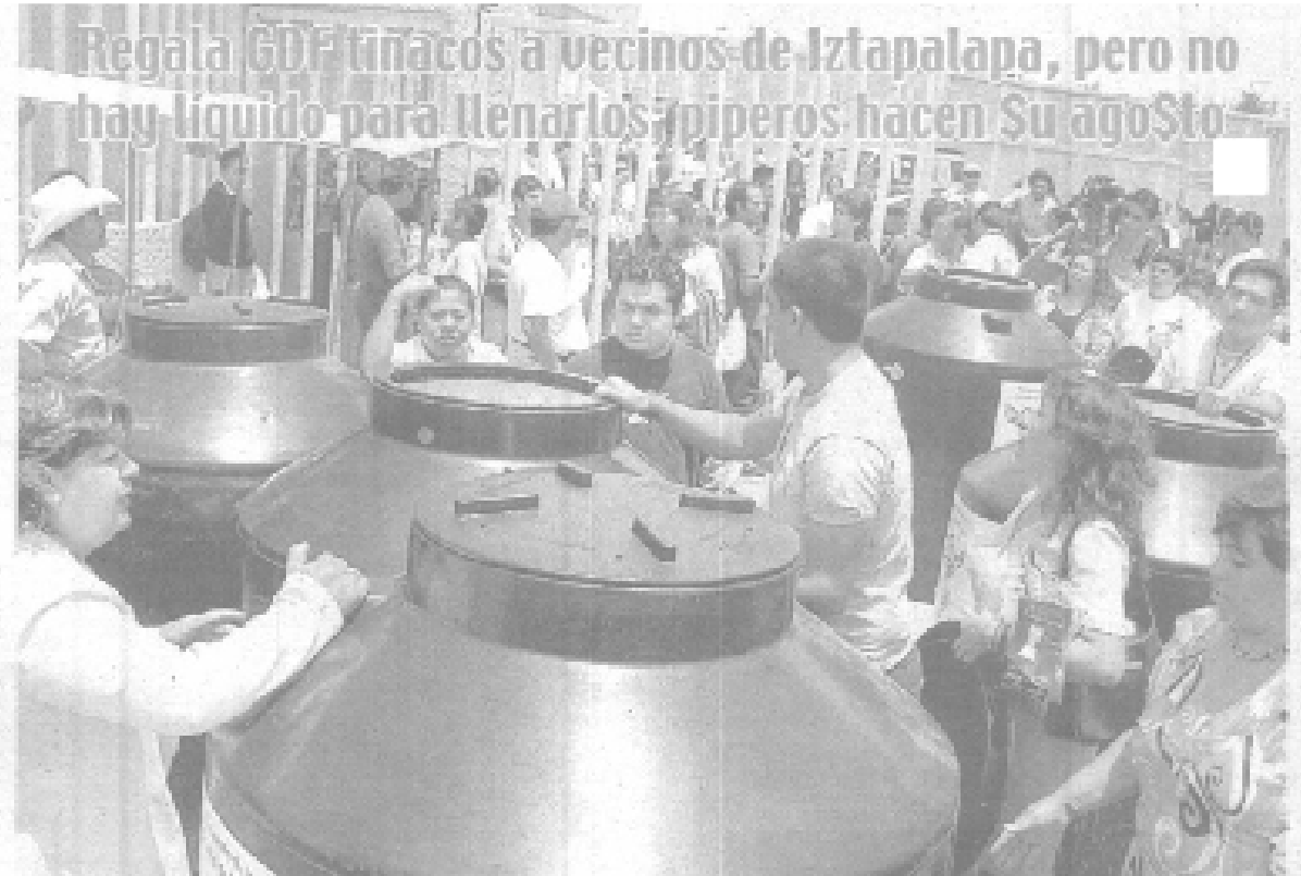
Regala GDF tinacos a vecinos de Iztapalapa, pero no hay líquido para llenarlos; piperos hacen su agosto