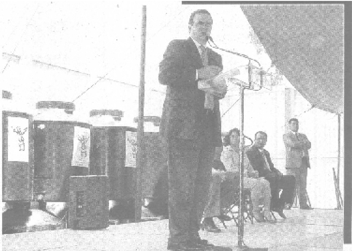
Familias de varias colonias de la Delegación Iztapalapa fueron beneficiadas con tinacos de 1,100 litros de capacidad, así como equipos hidrosanitarios ahorradores de agua que les entregó el jefe de gobierno capitalino, Marcelo Ebrard. (Foto: Irving Cabrera).

Recordó todas las acciones que su gobierno lleva a cabo para atender la problemática de agua, y señaló que en Iztapalapa se han construido cinco plantas potabilizadoras de agua, y están en proceso tres más, con tecnología que mejorará la calidad del recurso natural que se extrae de pozos.