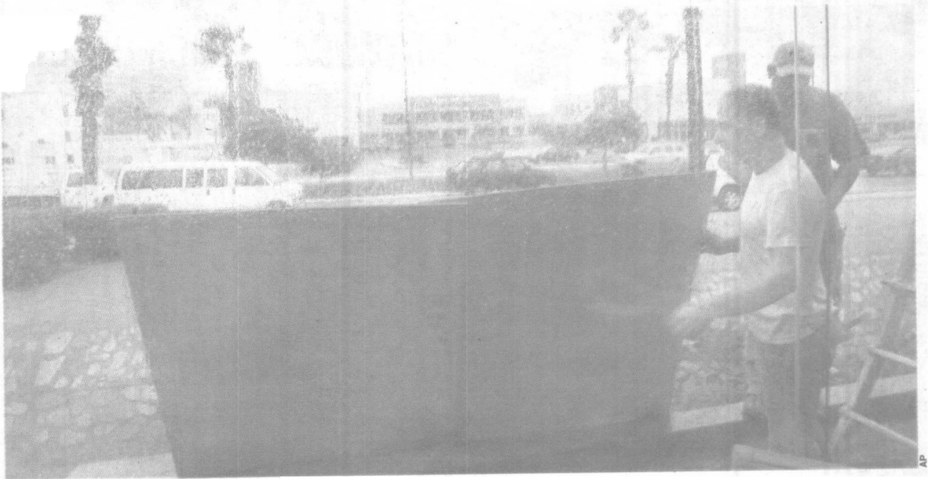
En comercios y hogares comenzaron a colocar madera en las ventanas para protegerlas del fenómeno natural que azotaría en la entidad