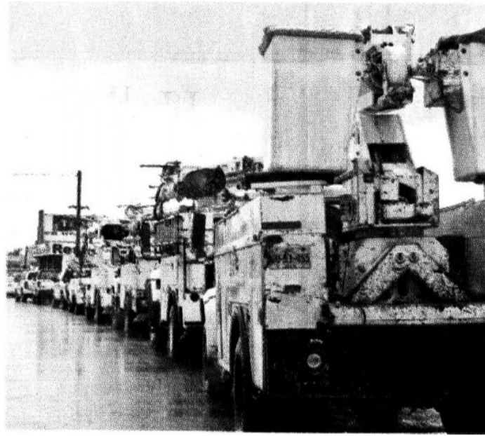
> Camiones de la Comisión Federal de Electricidad se trasladaron ayer al norte de Baja California Sur, donde se prevén los mayores daños.