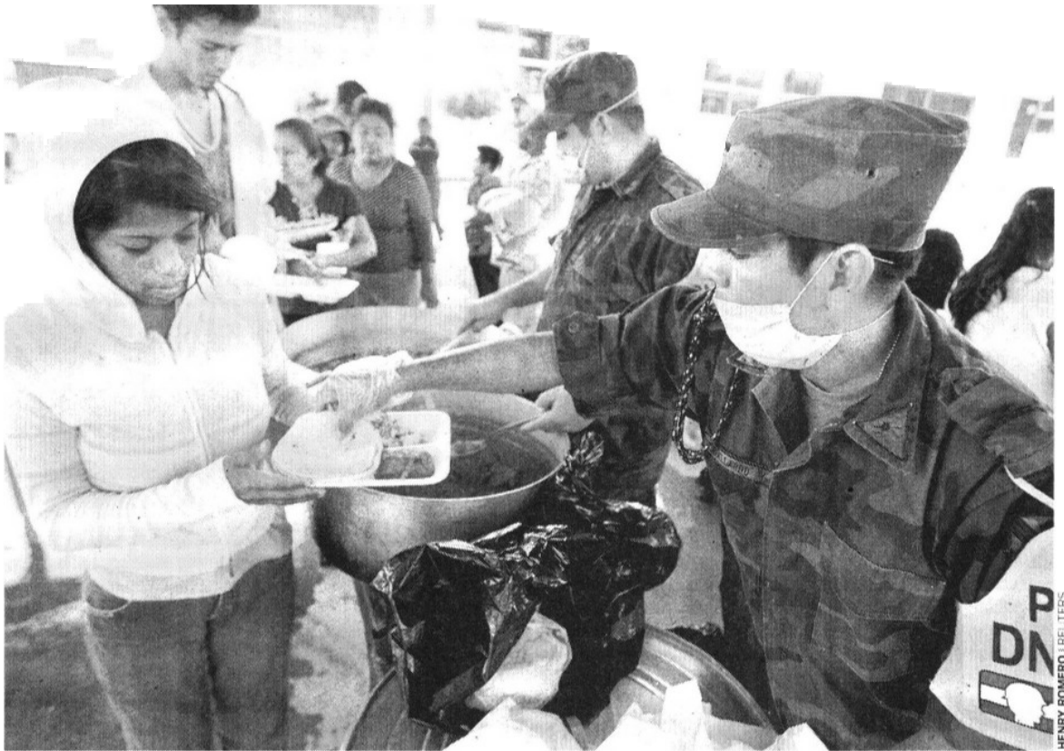
CONTINGENCIA. En San José del Cabo personal militar instauró el Plan DN-III