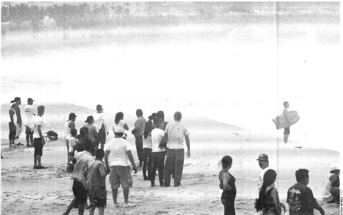
DESAFÍO. Pese al peligro, personas observan el fuerte oleaje en la ciudad turística de Los Cabos, en donde ya fueron evacuadas algunas colonias

En Coahuila, la Comisión Nacional de Agua informó que la presa Lázaro Cárdenas, el principal vaso hidráulico de la Laguna, se encuentra a 82% de su capacidad, por lo que mantiene seguimiento al comportamiento del huracán Jimena , para implementar medidas de prevención en caso que se presente una situación similar a la de 2008 cuando sobrepasó el 100%. (Con información de Javier Cabrera, Marcelo Beyltss y Enrique Proa)