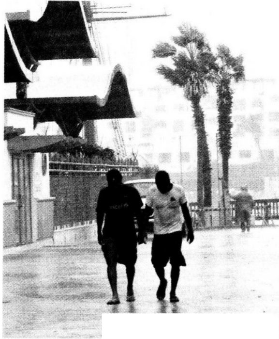
LA LLUVIA es fuerte y continua en La Paz.