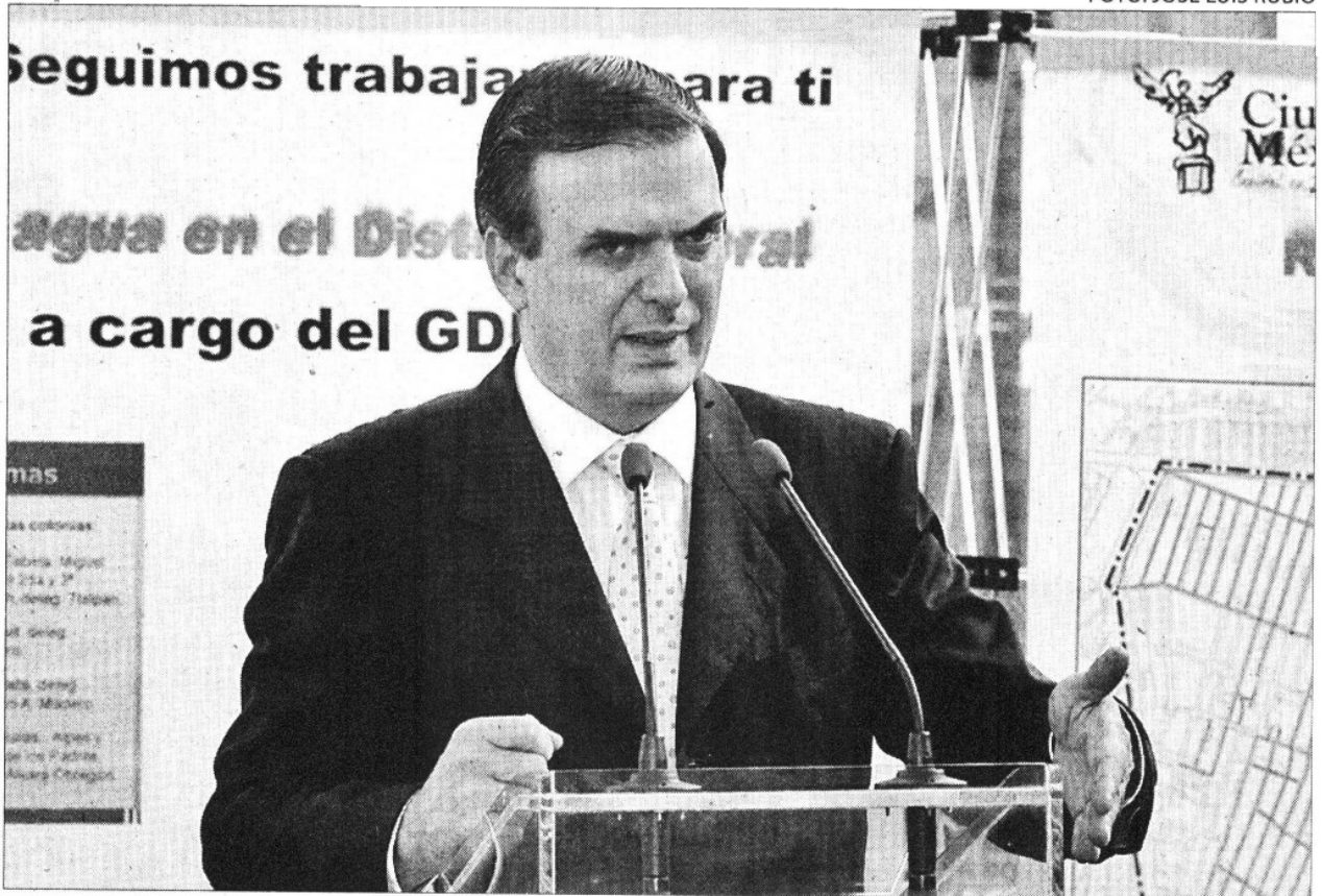
» EL JEFE de Gobierno, Marcelo Ebrard, impulsa medidas sobre ahorro y mejor distribución de aguas.