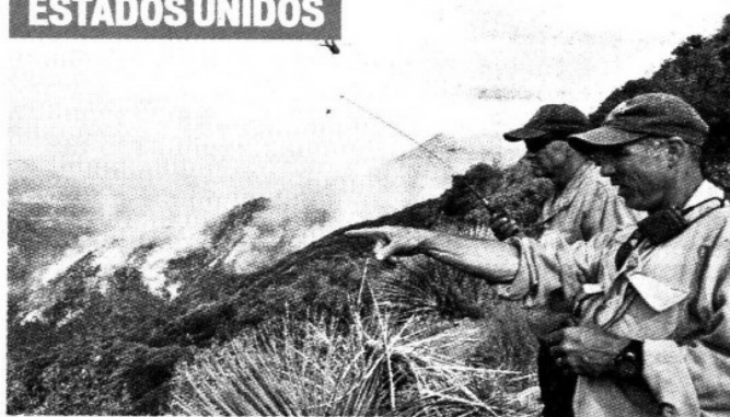
Cerca de la ciudad norteamericana de Los Ángeles se registraron graves incendios por la escasez de lluvias que registra el estado de California.