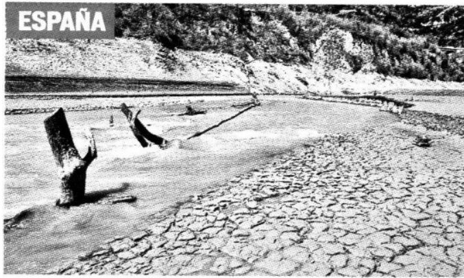
Las presas de agua en las metrópoli española de Barcelona almacenan apenas la cuarta de parte de su capacidad.