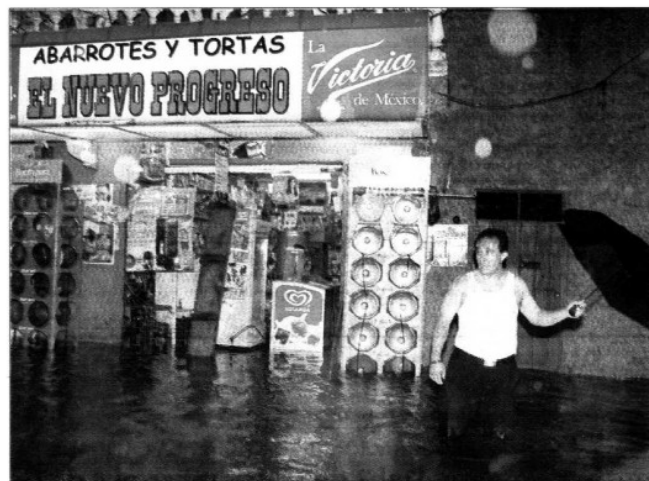
El oriente de la ciudad, como la colonia Jardín Bahuana, fue una de las zonas más afectadas por las lluvias que azotaron ayer la ciudad