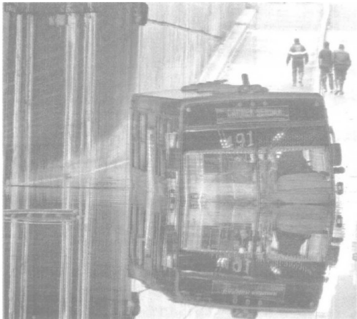
En el paso a desnivel de Congreso de la Unión y Circuito Interior un autobús se quedó varado con pasajeros, mismos que fueron evacuados en lanchas