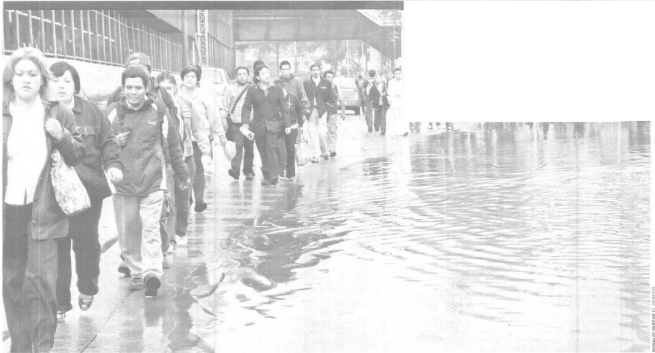
Miles de usuarios tuvieron que buscar rutas alternas, ya que una parte de la línea quedó inundada; incluso, las vías parecían albercas toda vez que el agua estancada superó el metro y medio