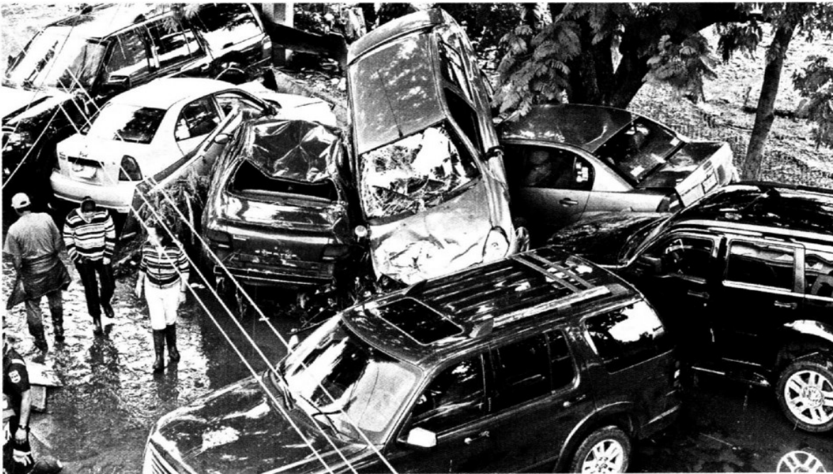
VALLE DORADO. Centenares de vehículos fueron afectados por la torrencial lluvia. La estampa más espectacular se dio en Tlalnepantla.