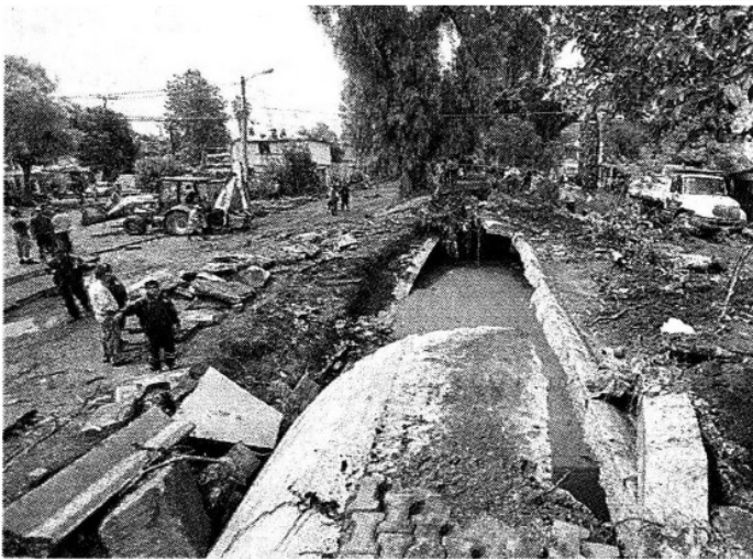
El ducto colapsado mide cuatro metros de diámetro