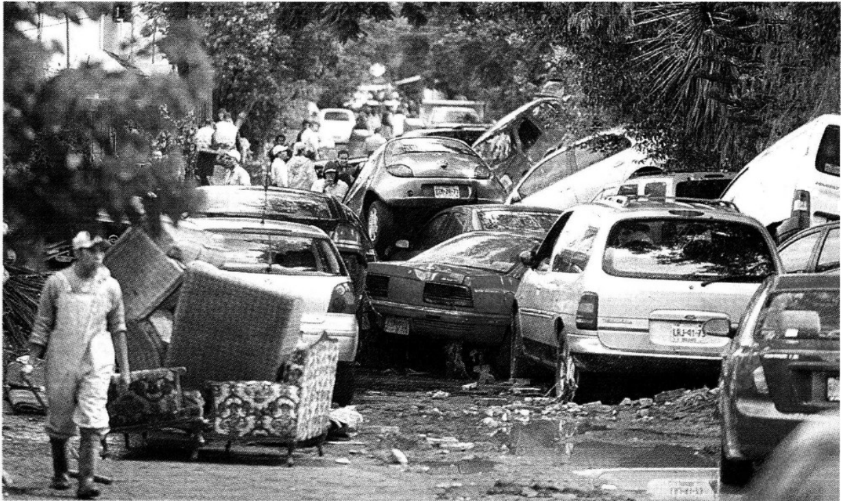
Decenas de automóviles fueron arrastrados por la corriente