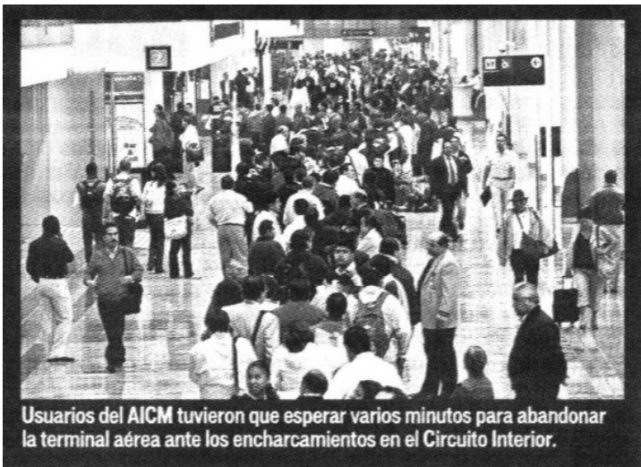
Usuarios del AICM tuvieron que esperar varios minutos para abandonar la terminal aérea ante los encharcamientos en el Circuito Interior.