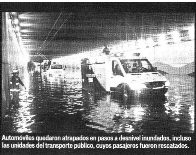
Automóviles quedaron atrapados en pasos a desnivel inundados, incluso las unidades del transporte público, cuyos pasajeros fueron rescatados.