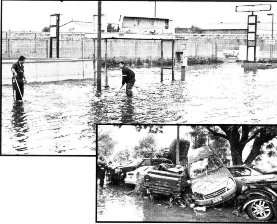
EN LA GRÁFICA superior, la estación Hangares inundada; en la inferior, más carros de Tlalnepantla destruidos.