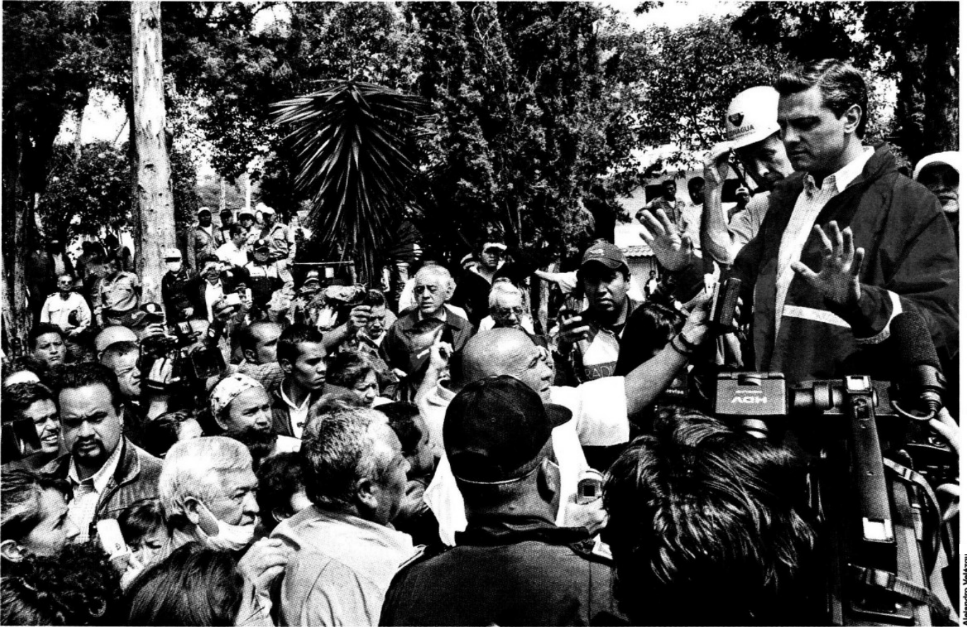
> El Gobernador Peña pidió calma a los damnificados durante el recorrido en la calle Caracas.