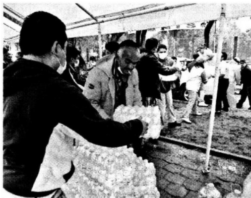
► Las autoridades repartieron botellas de agua a los vecinos.