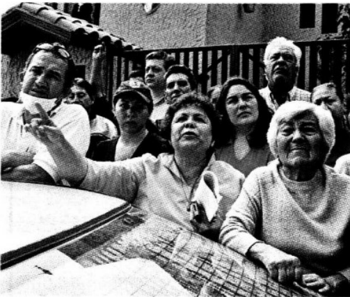
> Los vecinos no dejaban de pedir ayuda a gritos.

> Empleados de distintas corporaciones usaron el agua de una alberca para limpiar la calle.