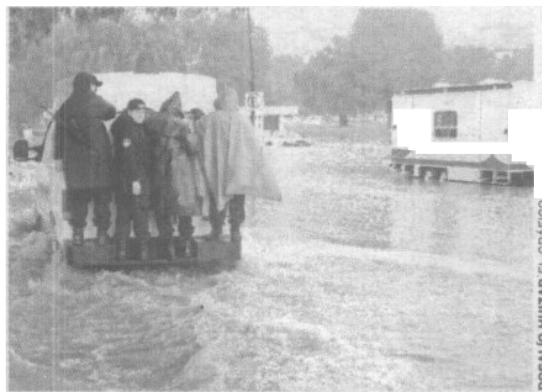
Severos daños se registraron en las inmediaciones del Reclusorio, donde el agua alcanzó los 50 centímetros de alto