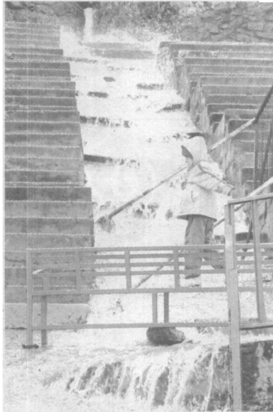
En cascada caía el agua de la sierra de Cuauhtepc, en la delegación Gustavo A. Madero