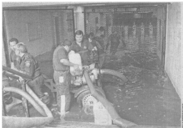
Se espera que pronto sean reabiertas las estaciones de la línea 5 del Metro, las cuales ya llevan más de 50 horas sin servicio, luego de las inundaciones

Las autoridades atribuyen a esta deficiencia que el agua de la tormenta bajara hasta las instalaciones del Metro