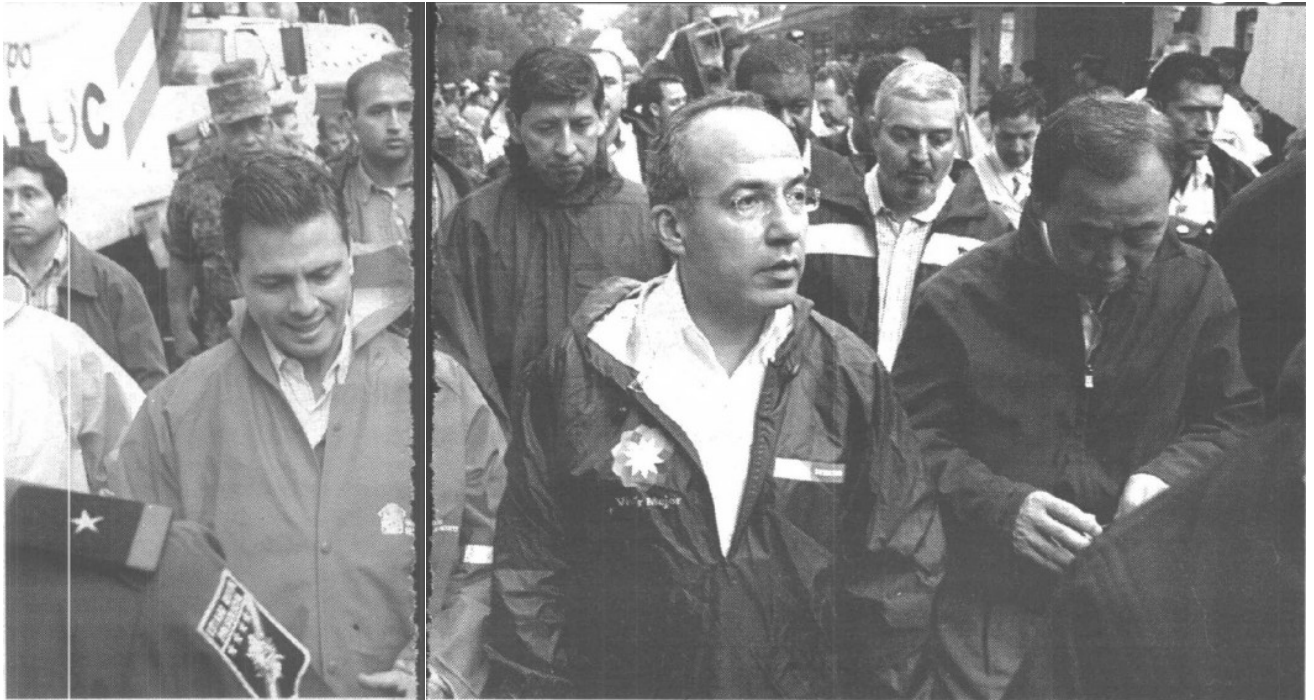
Enrique Peña Nieto, Felipe Calderón Hinojosa y Bam Ki-moon.