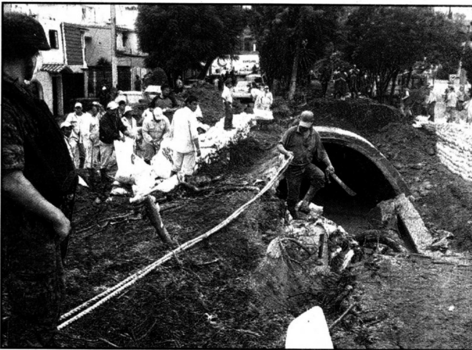
APOYA EL EJERCITO TLALNEPANTLA.- Costales de arena para evitar otra fuga, mientras reparan.

El mandatario señaló que personal de la Secretaría de Desarrollo Social (Sedesol) levantará en los próximos cuatro días un censo para diagnosticar los daños en las casas.