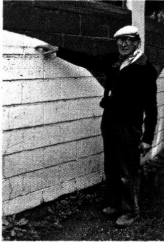
► Ortas muestra el nivel que alcanzaron las aguas negras.