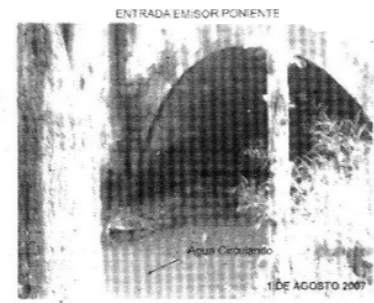
ENTRADA EMISOR PONIENTE