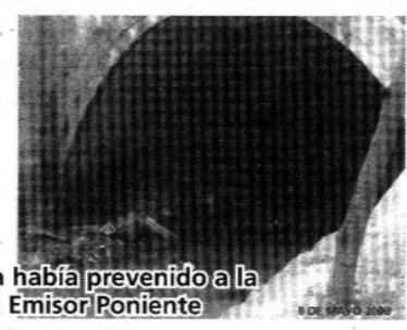
8 DE SEPT 2009

En estos documentos y foto, se muestra que en el año 2007 Sapasa había prevenido a la Conagua sobre el alto nivel de azolve en que se encontraba el Emisor Poniente