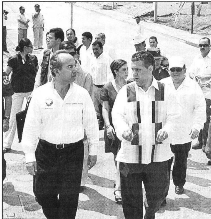
RECORRIDO. El presidente Felipe Calderón y el gobernador Juan Sabines caminan por una de las calles de la nueva unidad habitacional