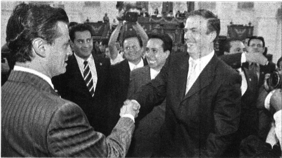
» MARCELO EBRARD y Enrique Peña Nieto tuvieron un efusivo encuentro.

Aunque el funcionario omitió mencionar el caso de la tragedia New's Divine, advirtió que las autoridades deben hacer más en el tema de la seguridad, a fin de evitar que haya policías involucrados con la delincuencia y duplicar el esfuerzo, para entregar los resultados que la ciudad merece.