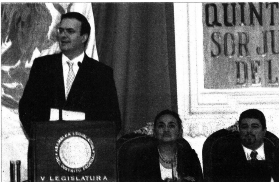
» MARCELO EBRARD, jefe de Gobierno del Distrito Federal, dijo que existe una política en contra de la Ciudad de México, impuesta por el Gobierno federal. "Es un error y es muy costoso para los capitalinos".