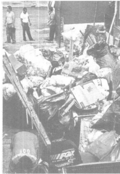
Ayer aguas negras, hoy desperdicios.

»» Desata anegación del Bordo Poniente tiraderos en calles y banquetas por la falta de recolección