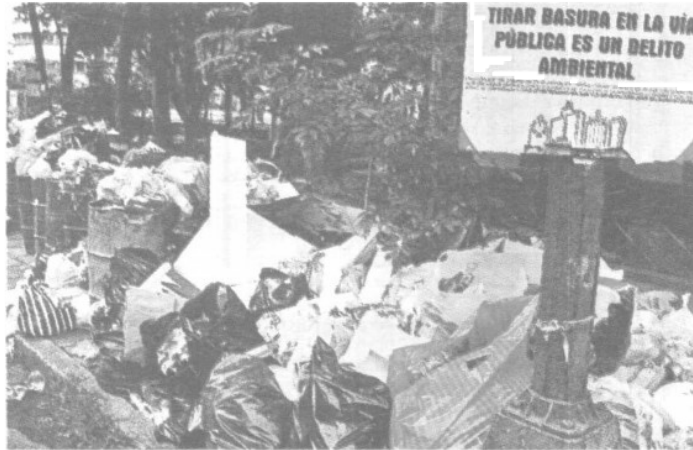
Entre las colonias en donde se vieron montones de basura más grandes destacan la Roma, Doctores, Obrera y Centro.

500 metros más cubrió la inundación ayer