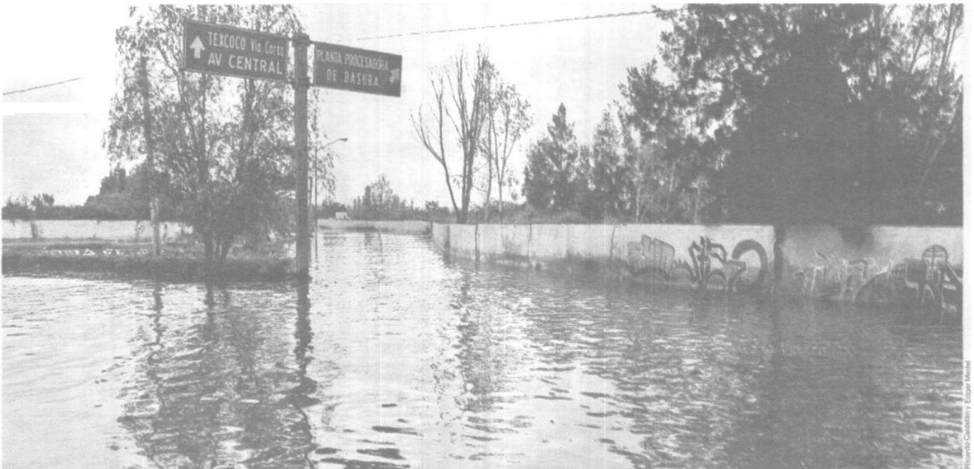
Los pepenadores de la planta de selección ni siquiera pudieron entrar a laborar, porque todas las instalaciones por el anegamiento de hasta 1.5 m. de altura.