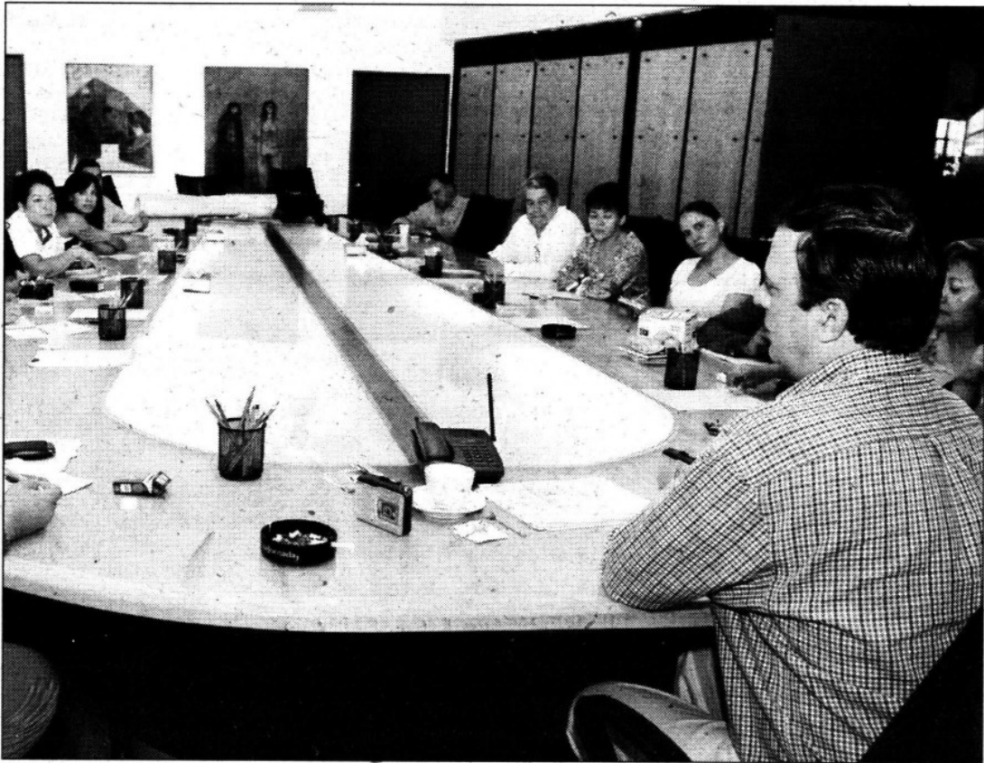
Marcelo Ebrard, durante la entrevista en las instalaciones de La Jornada

EN IZTAPALAPA NO SE VALE DECIRLE A LA GENTE QUE NO SE CUMPLIRÁ LO DICHO; SERÍA GRAVÍSIMO