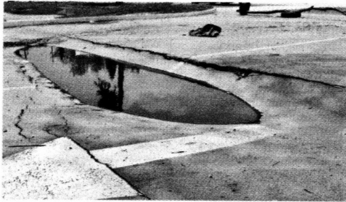
> Actualmente los hundimientos sobre el camellón del Bulevar López Mateos, que corre sobre el afluente, son notorios.