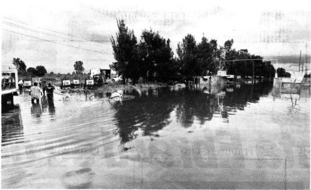
El basurero Bordo Poniente tuvo una complicación para el depósito de basura por las lluvias tan copiosas que dieron en esa zona de la Ciudad, pero ya está regularizado, aseguró el Secretario de Gobierno del DF.