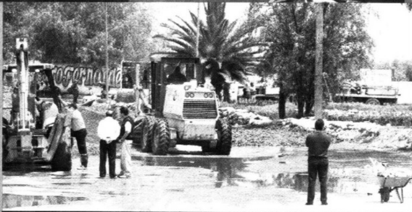
Ayer se denunció que el derrame del Bordo Poniente contaminó el agua de siete municipios mexiquenses.