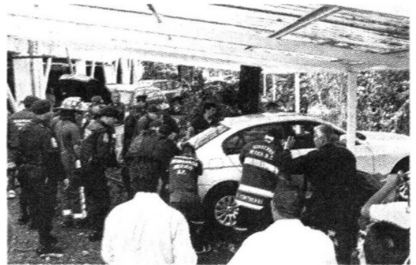
Protección Civil y la Delegación Álvaro Obregón realizan peritajes para determinar responsabilidades de tipo penal.