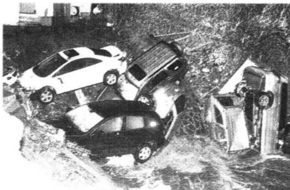
Al caer un muro provocó un tapón, lo que originó acumulación de agua y el desbordamiento que arrastró 17 vehículos.