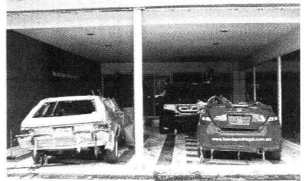
Tras determinarse que realizaron una construcción irregular, las agencias automotrices fueron clausuradas.