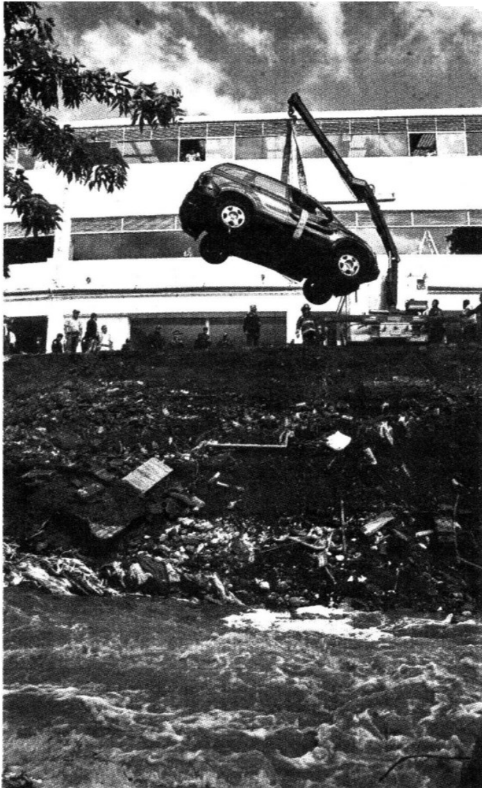
Personal del Cuerpo de Bomberos tuvo que rescatar del Río Magdalena los vehículos que fueron arrastrados a las laderas.