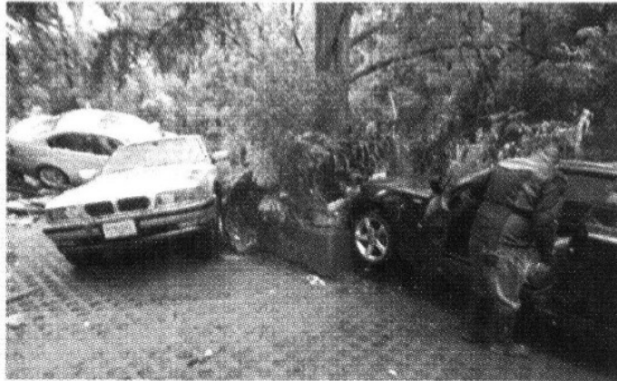
Las pérdidas por los autos dañados en la agencia de BMW ascienden a 6 millones 500 mil pesos, que cubrirá una empresa aseguradora.

120 EMPLEADOS de Bomberos y Protección Civil atendieron el desbordamiento