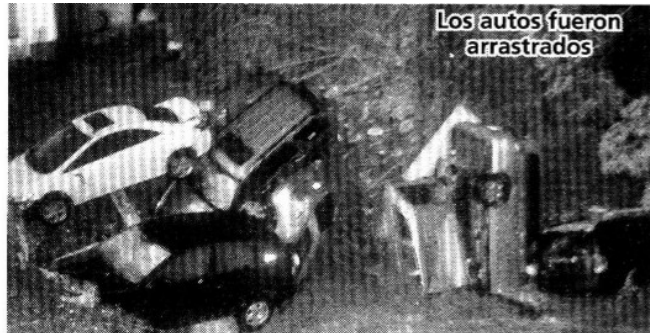
Los autos fueron arrastrados