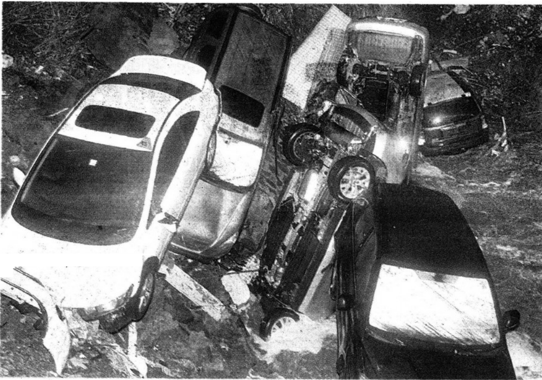
Autos nuevos y seminuevos formaron un tapón en el Río Magdalena que provocó el desbordamiento y la inundación en la zona.