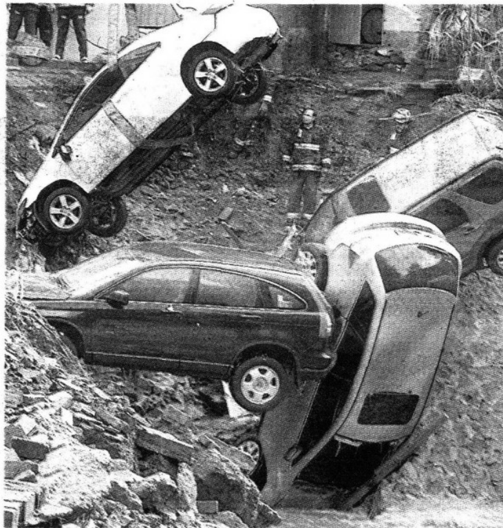
Los vehículos que cayeron al cauce del río fueron sacados por medio de grúas.