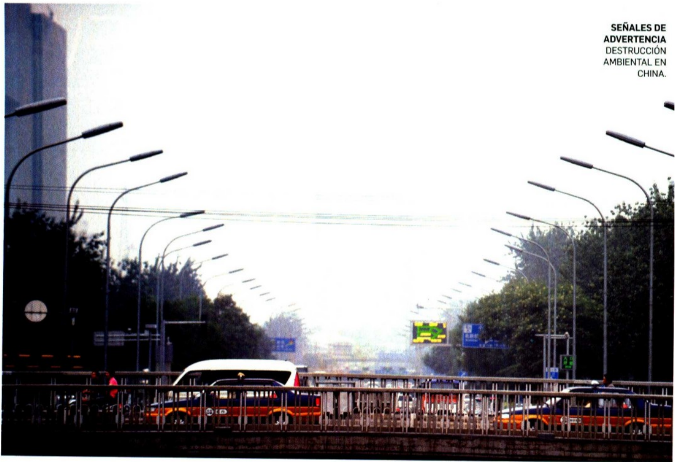
SEÑALES DE ADVERTENCIA DESTRUCCIÓN AMBIENTAL EN CHINA.