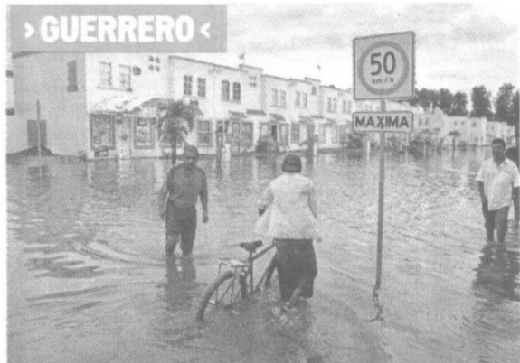
Algunas colonias del puerto de Acapulco registraron inundaciones.