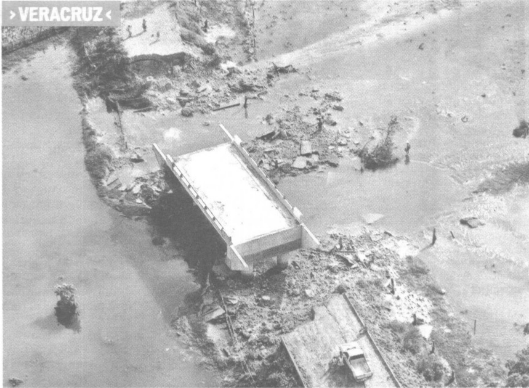
De acuerdo con los reportes del Gobierno de Veracruz, mil 500 kilómetros de caminos han resultado afectados por las lluvias en la entidad. Asimismo, hay daños en 100 comunidades de 62 municipios.