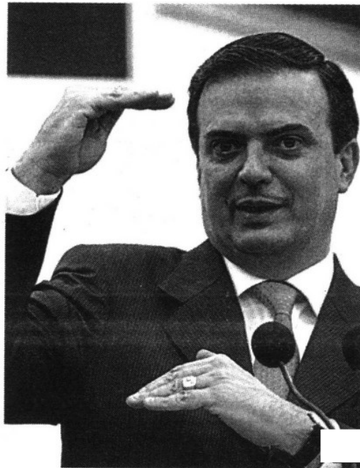
Marcelo Ebrard. No sube el predial.