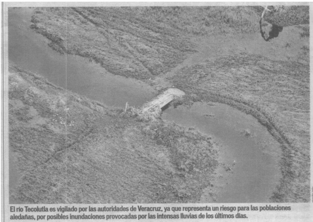
El río Tecolutla es vigilado por las autoridades de Veracruz, ya que representa un riesgo para las poblaciones aledañas, por posibles inundaciones provocadas por las intensas lluvias de los últimos días.