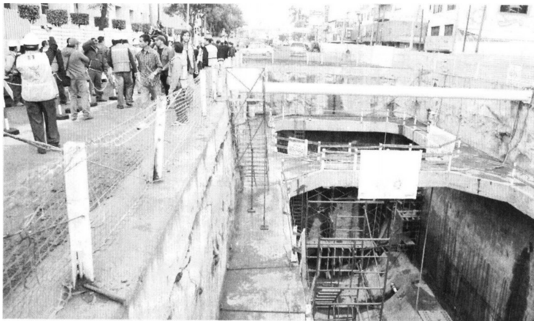
PUNTO DE INICIO. Ya está lista, en la zona de Mexicaltzingo, la lumbrera por donde entrará la tuneladora para abrir el tramo subterráneo de la línea 12

de la Línea Dorada se han completado hasta ahora