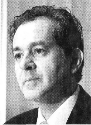
JUAN R. ELVIRA QUESADA TITULAR DE SEMARNAT $150,151

Las fotografías de al lado muestran a las ocho personas con mayores ingresos dentro de la Secretaría de Medio Ambiente y Recursos Naturales. Cada foto va acompañada del nombre del funcionario, su cargo y su salario. Hasta el momento no hay ningún plan para recortar el sueldo de aquellos burócratas que más ganan.