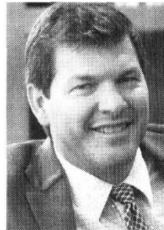
PATRICIO PATRÓN L. TITULAR DE PROFEPA $138,681