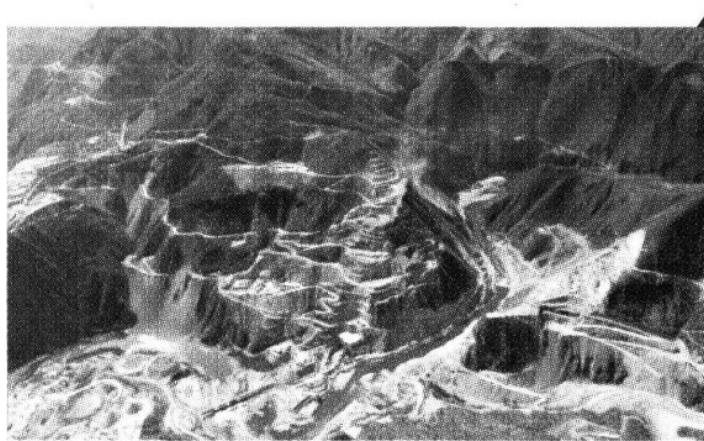
La hidroeléctrica La Yesca está entre los proyectos más grandes.

47 POR CIENTO aumentaron sus ingresos durante el segundo trimestre de 2009