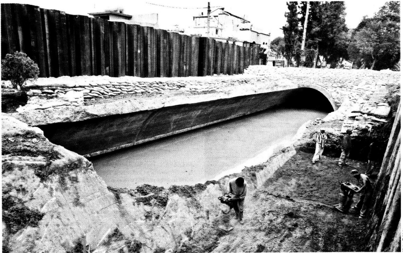
› Los costales fueron apilados en una de las calles aledañas en caso de emergencia.