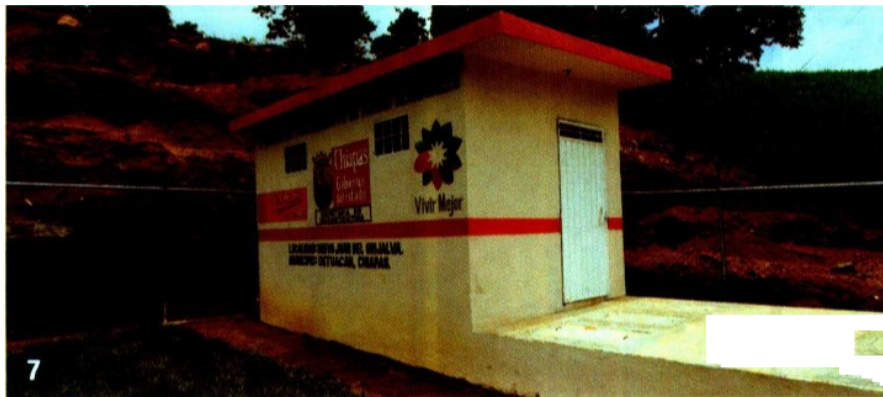
Por otra parte, y de conformidad con los requisitos que plantea este objetivo de la ONU, el sistema de agua potable de Nuevo Juan de Grijalva dotará a cada habitante de 200 litros diarios.