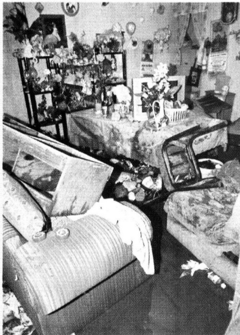
Nueve colonias fueron las más afectadas en la GAM.

1 DECESO por infarto vincularon las autoridades con la fuerte tormenta