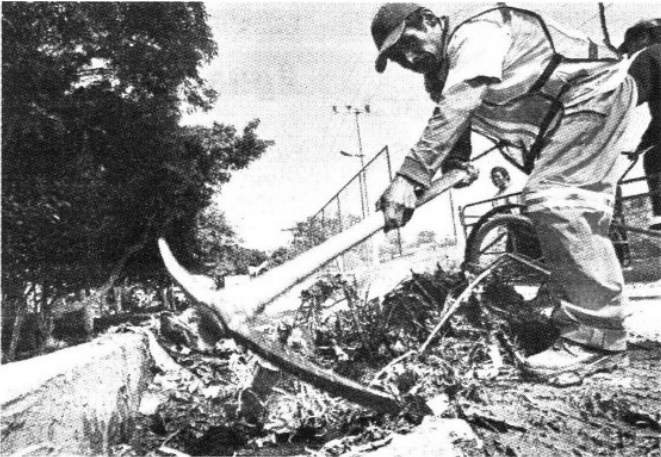
10 mil metros cuadrados de asfalto ya se enviaron a las zonas dañadas de Cuauhtepc, en la GAM, para iniciar la rehabilitación de vialidades.