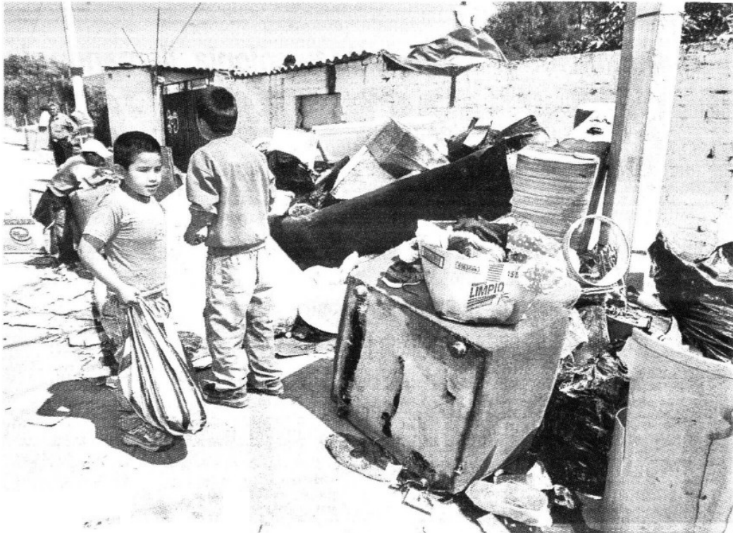
El Jefe de Gobierno capitalino señaló que la negativa del GDF para permitir el ingreso del Ejército Mexicano y la aplicación del plan DN-3 fue por razones de orden y no por soberbia.