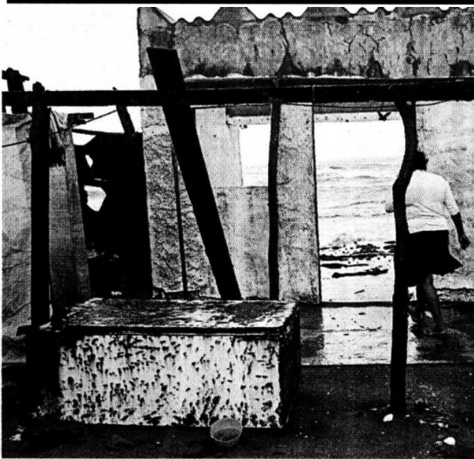
› En Sánchez Magallanes, Tabasco, varias casas quedaron destruidas por el fuerte oleaje que hay en la zona.