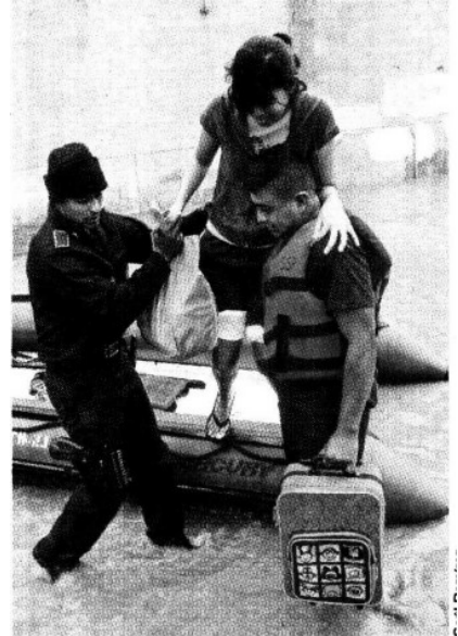
› Elementos de la Armada dan apoyo a habitantes de Agua Dulce.